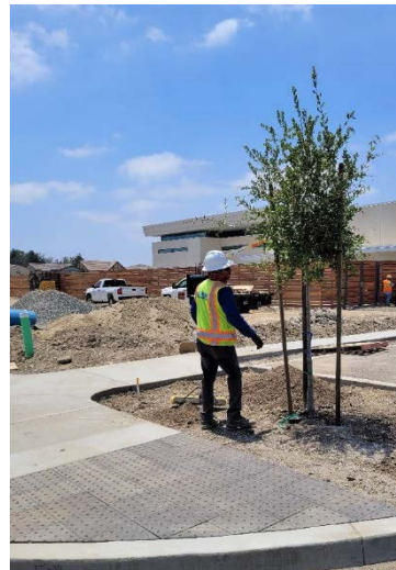
Plantando árboles en el patio