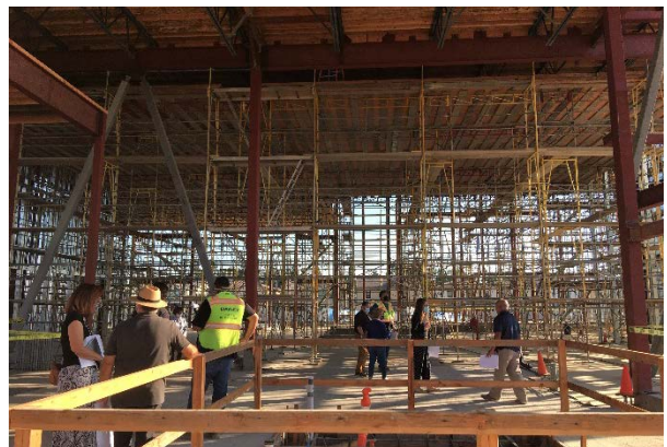
Mirando a la iglesia desde la fuente Bautismal