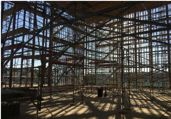
Andamios dentro de la Iglesia

Si ya ha hecho su promesa de ayudar a construir nuestra Iglesia permanente y el Centro Parroquial, ¡GRACIAS! Si estaba esperando para ver si realmente construiríamos la iglesia antes de hacer una promesa, ¡AHORA es el momento!