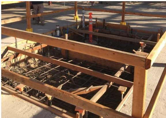
La piscina bautismal y la fuente empotrada en la entrada