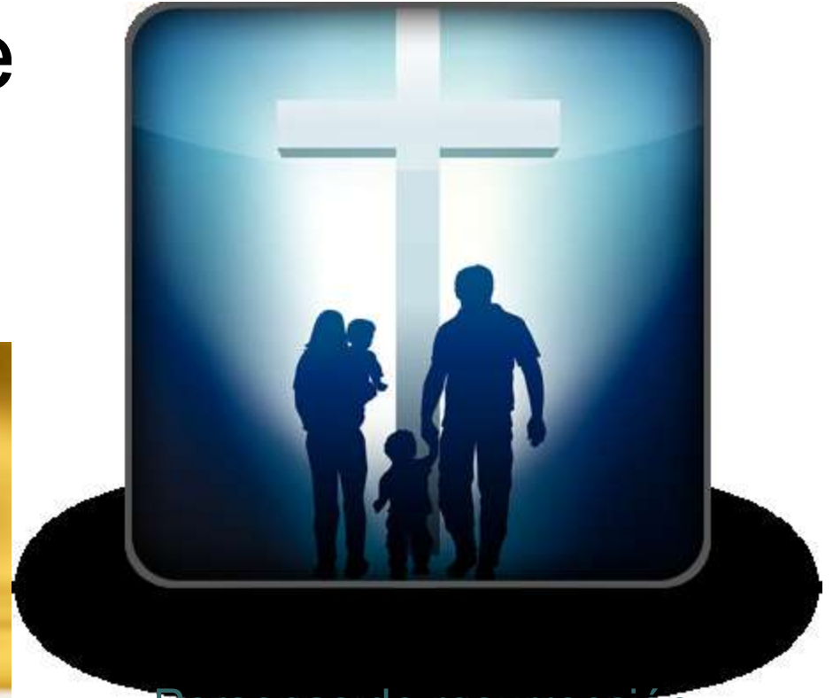
Personas de resurrección