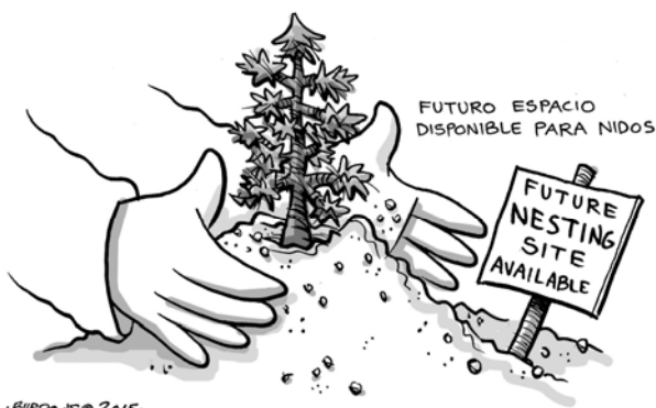
The Little Ones

Thus says the Lord God: I, too, will take from the crest of the cedar, from its topmost branches tear off a tender shoot, and plant it on a high and lofty mountain; Birds of every kind shall dwell beneath it, every winged thing in the shade of its boughs. Ez 17:22,23